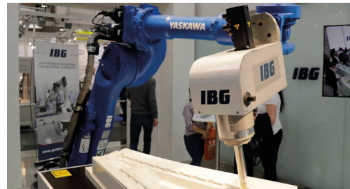
3D-Preformbeschnitt mit Ultraschallmesser.

Der letzte Messetag ist angebrochen. Auch auf der diesjährigen Hannover Messe haben wir es geschafft außergewöhnliche Applikationen, innovative Neuerungen sowie zukunftsweisende